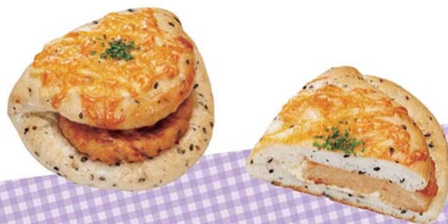
柚子胡椒つくねバーガー 173円(税込)