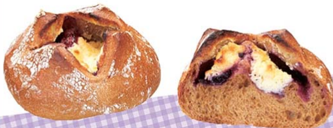
ブルーベリーチーズフランス 184円(税込)