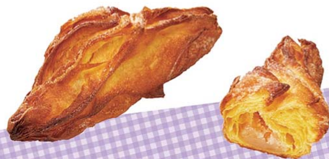
甘夏みかん餡クロワッサン 124円(税込)