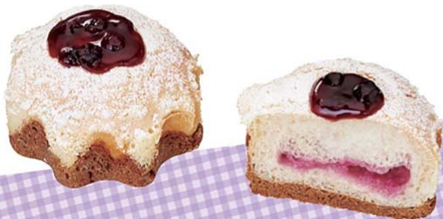
ブルーベリー&カシス 162円(税込)