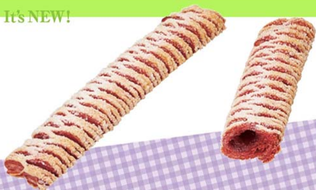
あまおう苺とルバーブのパイ 124円(税込)