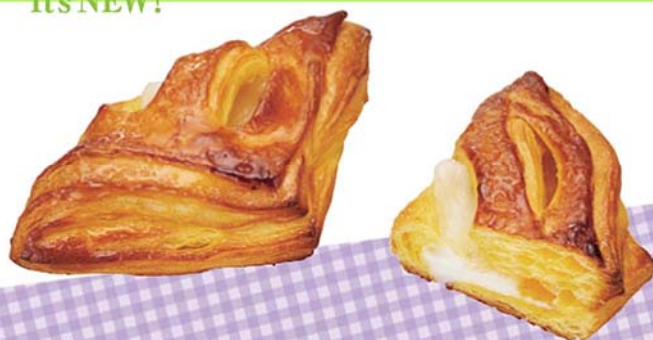
南国小夏デニッシュ 151円(税込)